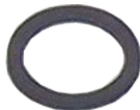
Pos. 95 - 99