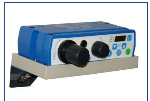
Detail Dosiereinheit für Flüssiggummi