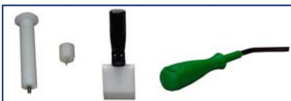
Werkzeuge zur Demontage der Vorrichtungen