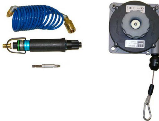
Fig. 02 图 02

02 pc Compressed-air torque screwdriver 压缩空气扭力起子 Including 包括 - Spring-loaded cable spool 弹簧式电缆线轴 - Spiral air hose 螺旋风管 Technical data 技术参数: - Compressed air requirem 压缩空气要求. 267l/min - Adjustable torque, max. 3.0 Nm 可调节扭力, 最大 3.0 Nm - Rotation speed 转速 1000 min-1 - Service pressure 工作压力 6 bar - Weight 重量 0.5 kg Part no.产品编号: 0100 0303 Customs-Declaration no.报关编号: 85439000