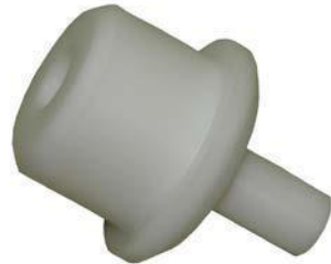
Fig. 05 图 05

05 pc Holding adapter for punch-out tool 弹出工具适配器 Part no. 产品编号: 0100 0306 Customs-Declaration no. 报关编号: 85439000