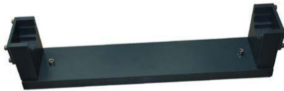
Fig. 10 图 10

14 pc Holder for contact fixture 接触夹具支架 Part no.产品编号: 0100 0315 Customs-Declaration no 报关编号.: 85439000