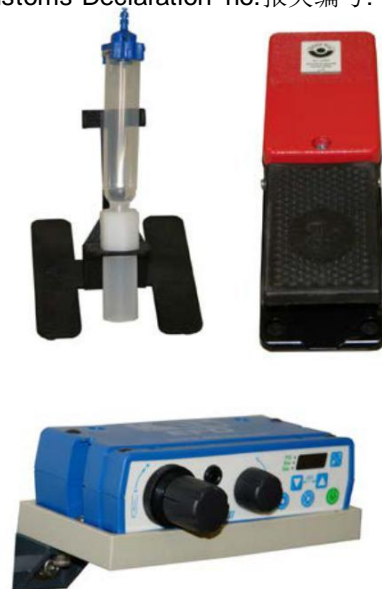
Fig. 03 图 03

Including 包括 - 10 pcs. cartridge 10 cm 3 10 个 10 cm 3 盒子 - Dosing needle set (50 needles) 配量针套装 (50 根针) - Cartridge adapter 10 cm 3 盒适配器 10 cm 3 - Foot switch 脚踏开关 Part no. 产品编号: 0100 0304 Customs-Declaration no. 报关编号: 85439000