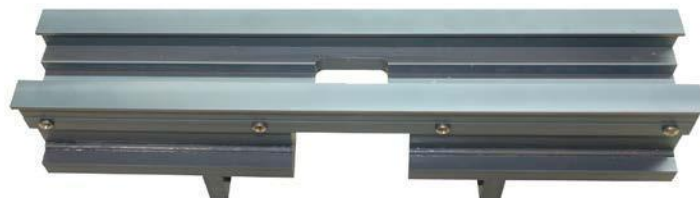
Fig. 06 图 06

06 pc Holder for contact fixture for removal of contact modules 用于从接触夹具移除接触模块的支架 Part no. 产品编号: 0100 0307 Customs-Declaration no. 报关编号: 85439000