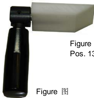
Figure 图 Pos. 13 编号 13