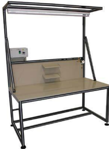
Fig. 01 图 01

Pos. 编号 Quant. 数量 Unit. 设备 Designations, dimensions, etc. 产品说明，规格等