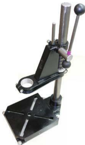
Fig. 04 图 04

Part no. 产品编号: 0100 0305 Customs-Declaration no. 报关编号: 85439000